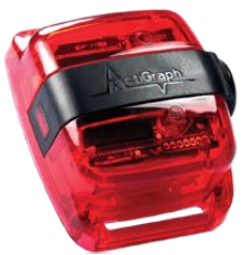
ActiGraph modèle GT3X