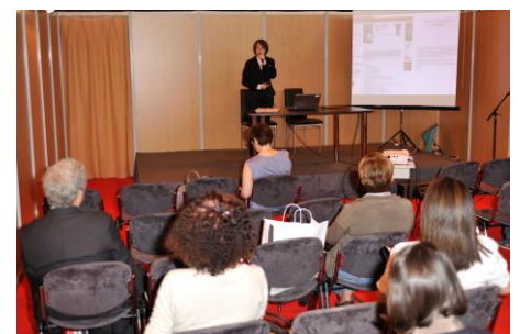
TSP Diffusion au salon i-expo 2011